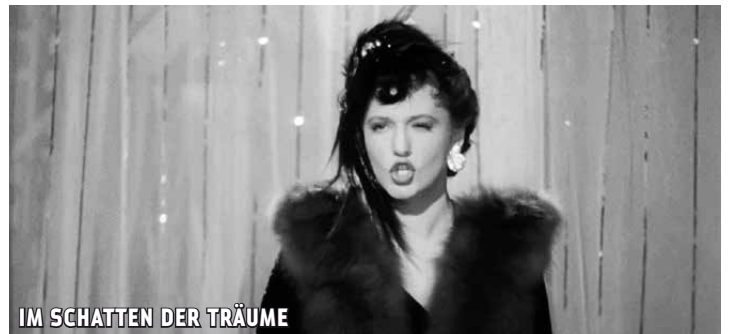
IM SCHATTEN DER TRÄUME

D/CH 2023 | R & B Martin Witz | K Till Vielrose | ab 12 J. | 80 Min. | BE