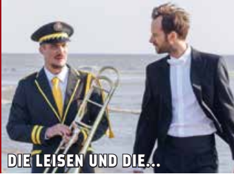
DIE LEISEN UND DIE...