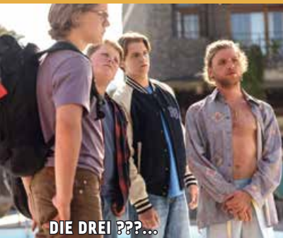
DIE DREI ???...