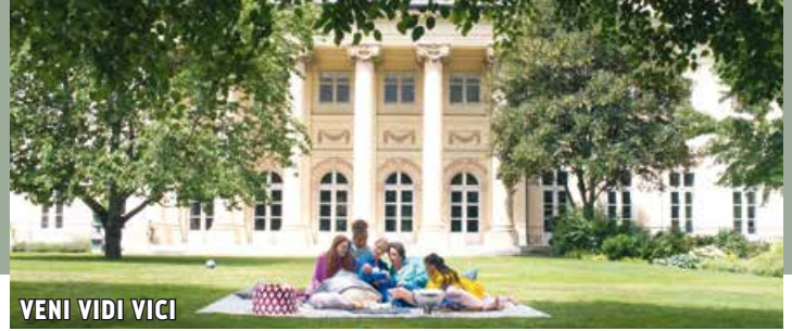
VENI VIDI VICI