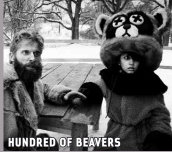
HUNDRED OF BEAVERS