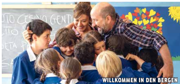
WILLKOMMEN IN DEN BERGEN