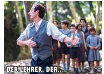
DER LEHRER, DER...