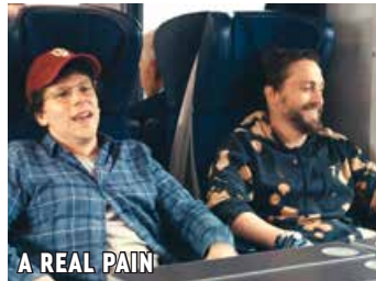
A REAL PAIN

USA 2024 | R, B & D s.o. | D s.o., Will Sharpe, Jennifer Grey, Kurt Egyiawan, Liza Sadovy | ab 12 J. | 91 Min. | BE